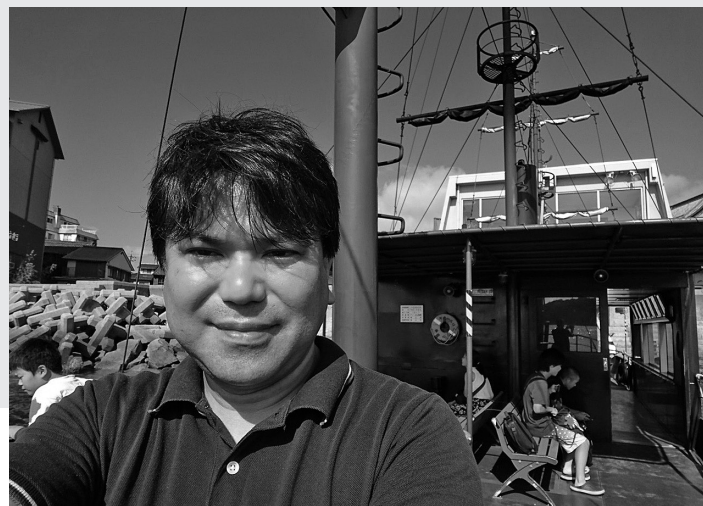
筆者。広島県鞆の浦、仙酔島の渡船上にて

明治期を代表する監獄建築「旧奈良監獄」。放射状に広がる整然とした構造には、人間の幸福への願いが込められていた。